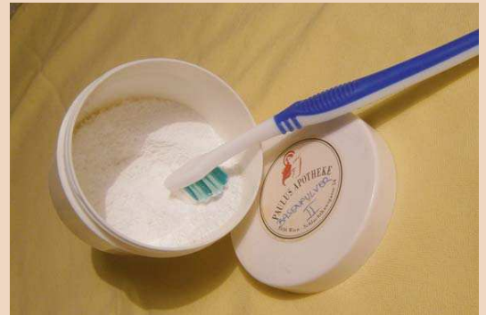
Putzen mit Soda.

Die Reaktion auf Entzündungen ist individuell unterschiedlich stark ausgeprägt, daher sind Hygienemängel nicht für alle gleich gefährlich. Allerdings summieren sich auch die Auswirkungen an sich unbedeutender Entzündungen im Körper und verändern das Zytokinmuster und damit die Reaktionsbereitschaft auf Reize aller Art. Eine länger andauernde Gingivitis kann somit die Basis für kardiovaskuläre Erkrankungen oder Diabetes bereiten. Für viele schwer bekämpfbare Probleme wie Materialunverträglichkeiten oder Fibromyalgien ist die einzig wirkliche Hilfe, alle erreichbaren Entzündungen im Körper zu eliminieren, um das Immunsystem zu entlasten. Aus unserem Bereich zählen dazu Zahnherde – von großer Bedeutung wegen der Lage direkt im Knochen – und Parodontalerkrankungen – brisant wegen der großen Ausdehnung.