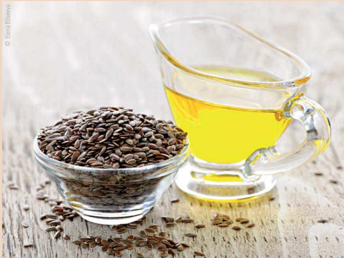
Leinsamen und Leinöl.